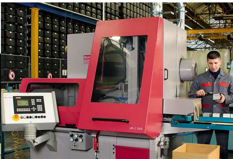
massgenau – abfalloptimiert – schnell

Ihr Vorteil: Profitieren Sie von kürzeren Durchlaufzeiten und abfalloptimierten Zuschnitten