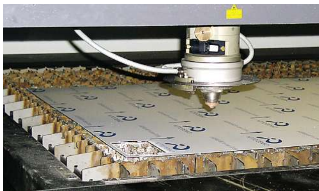
Vorgravieren, Abdampfen, Nachreinigen und Abschleifen werden eingespart