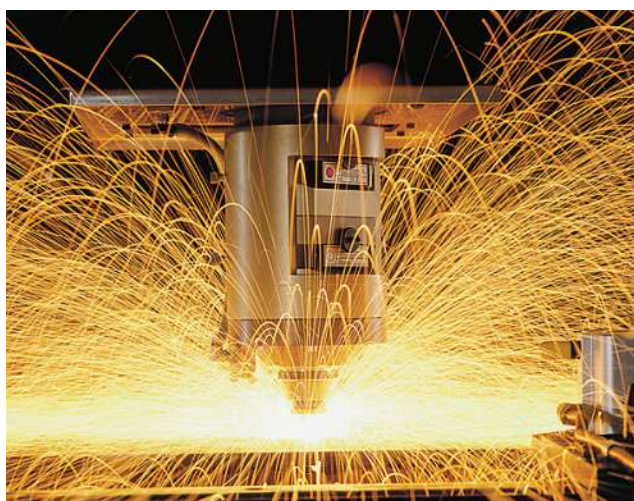
Hohe Vorschubgeschwindigkeiten des Lasers möglich