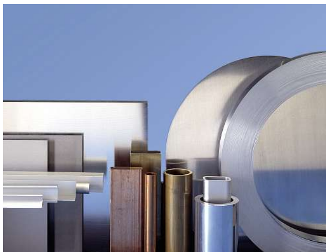
Das Multi-Metall-Angebot wird laufend Ihren Bedürfnissen angepasst

Sehr viele Kunden bestätigten die Anforderung, die Beschaffung zu vereinfachen und zu konzentrieren. Ihrem Wunsch entsprechend, runden wir das Kernsortiment Aluminium mit den Metallen Kupfer, Messing, Bronze und Edelstahl Rostfrei laufend ab. Verlangen Sie nach Lösungen, die Ihren gesamten Bedarf an Metallen abdecken und nutzen Sie mit Metall Service Menziken das Potenzial der Einsparungen mit der Bündelung dieser Metalle.