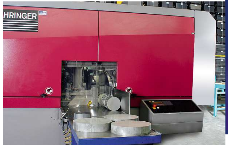
Bandsäge: Stücklängen von mind. 6 bis max. 540 mm